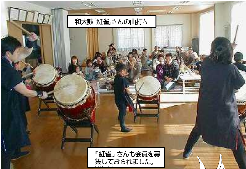
和太鼓「紅雀」さんの曲打ち