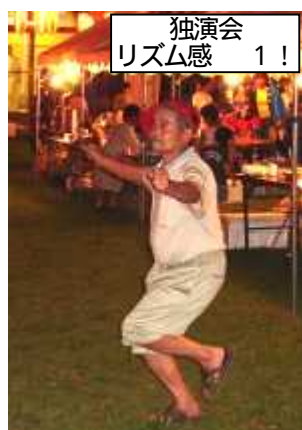
独演会 リズム感 1!