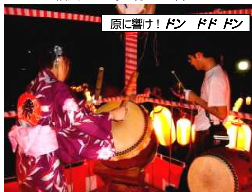
原に響け! ドン ドドドン