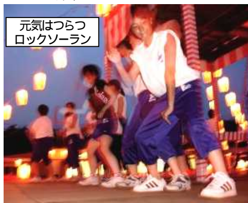
元気はつらつ ロックソーラン