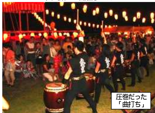
圧巻だった「曲打ち」