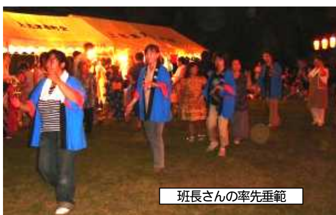
班長さんの率先垂範