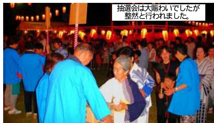
抽選会は大賑わいでしたが整然と行われました。