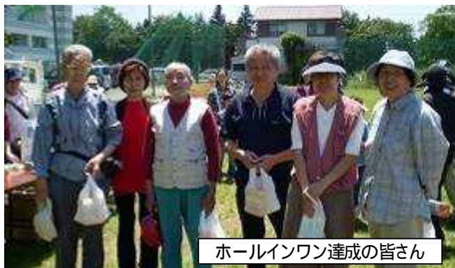
ホールインワン達成の皆さん