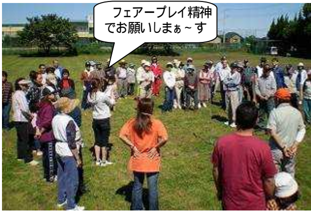
フェアプレイ精神 でお願いしまあ~す