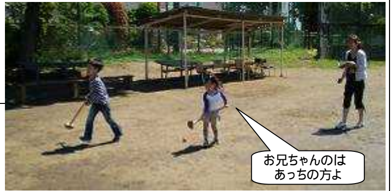
お兄ちゃんのは あっちの方よ