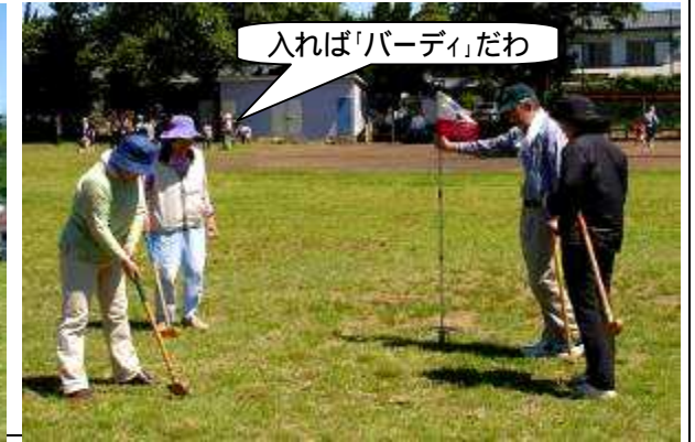
入れば「バーディ」だわ