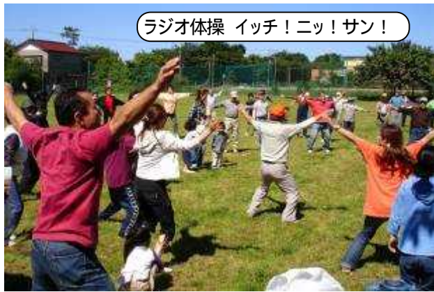
ラジオ体操 イッチ! ニッ! サン!