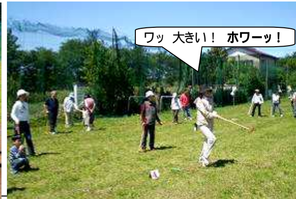
ワッ 大きい! ホワッ!