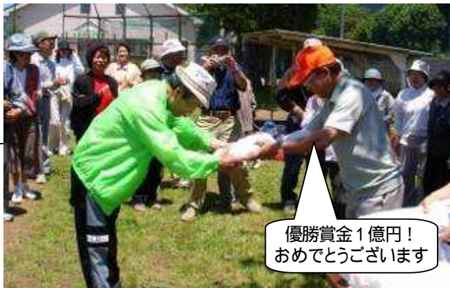
優勝賞金1億円! おめでとうございます

おめでとうございます こうして大会は楽しく、無事終了しました。班長の皆様ご苦労様でした。