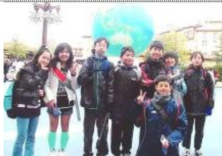
メッソーセージをくださった6年生の皆さん

私の担当した1年生はし っかりしていて、きちんと グループ行動ができていた ので、とても感じしました。