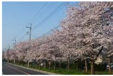
上志津原ふれあいとおりの桜 さあ、ふれあいとおりの桜が満開 です。昭和39年、市制10周年記念 に市から苗木の配布を受け、開拓農 家の方々が植樹したのが始まり。今 では佐倉市の桜の名所のひとつに。

3月11日、東北関東大震災が 発生しました。 とても怖かったですね 未曾有な事態が進行しており、 一日も早い収束を願います。 ご実家、ご親戚、お知り合いの 方のごことなど、ご心配をされてい る方も多いとお察します。 ご無事でありますようお願いい お察し申し上げます。