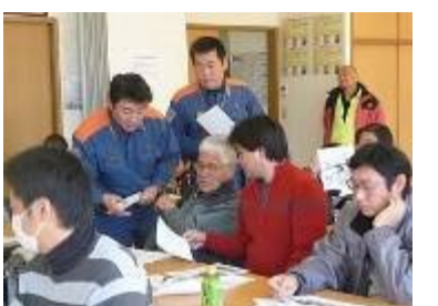
住宅用火災警報器を設置しましたが、と消防署員。

志津地域で今年に入つてすでに火災が5件発生している、放火が多いので家の廻りに物を置かないように、など具体的なお話で為になりました。住宅用火災警報器や緊急通報システムのお話もありました。