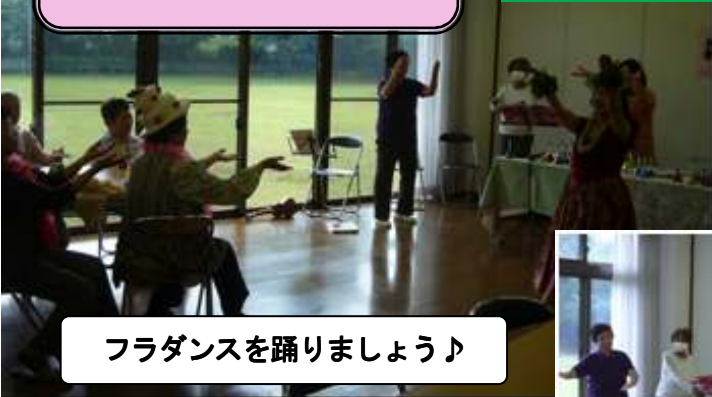
フラダンスを踊りましょう♪

ベルの音は天使の贈り物で『幸せを呼ぶ音色』と言われ、演奏する人も聞いた人も幸せになれるそうです。