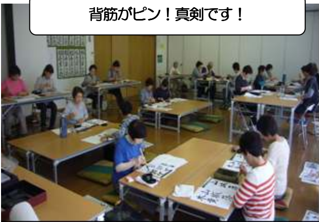
背筋がピン! 真剣です!

最初は朗らかな雰囲気でしたが、いざ書き始めると皆さん真剣な表情で、姿勢も「背筋がピン」と伸びて、心地よい緊張感が漂います。そして書きあがった字が、皆さん達筆で素晴らしい!