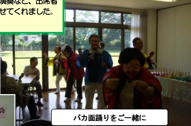
バカ面踊りを一緒に