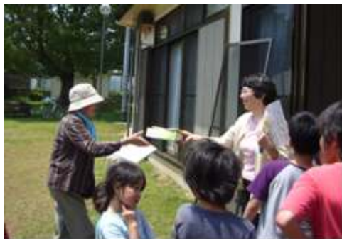
成績発表&景品の授与 全員もれなく何かいただけます！