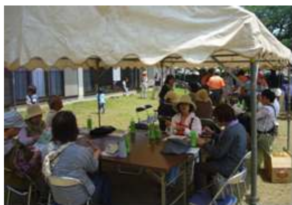
原公園で昼食。たくさん歩いた後、こういう雰囲気食べる食事はおいしいですね！