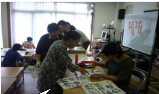
いっしょに書いてみる

書いた半紙を持って先生の前に並ぶと、一人ずつ添削とアドバイスをしていただけます。「字のバランス」や「筆の運び方」など、細かく的確なアドバイスで、傍で聞いているだけでも参考になりました。中には「字を書くスピードが速いのよね」と指摘されて「字を見ただけで、書いたスピードまで分かっちゃうんですか?」という驚きの声も上がりました。皆さんとても熱心で、他の方が言われているアドバイスにも耳を傾けながら並んでいらっしやいました。 今回は普通の半紙でしたが、6月~8月にかけては『色紙』に書くそうです。「色紙に書くのは難しい」ということで、「最初から上手くは書けないので、最終的に提出するのは8月」