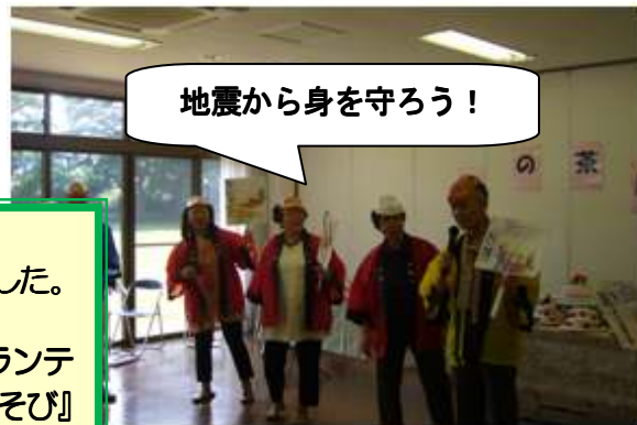
地震から身を守ろう!

『ミュージックベル・歌あそび』というボランティアグループの皆さんが、『防災・減災・歌あそび』というテーマで、踊りや歌やベル演奏など、出席者も一緒にやる『参加型』で楽しませてくれました。