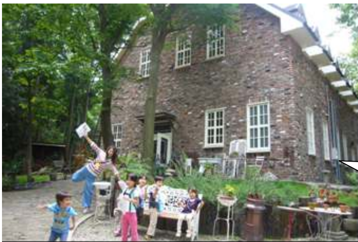
素敵なアンティークショップを発見！

到着した時には、スタートから1時間以上経っていました。あつという間に感じられ、「お腹がすいたあ」と言っていた子供達は、おいしそうに焼きそばをほおぼっていました。焼きそば以外にも、お好み焼き風の『キャベツ焼き』や、『フランクフルト』も販売され、鉄板でジュージュー焼いてくれるのが魅力的でした。