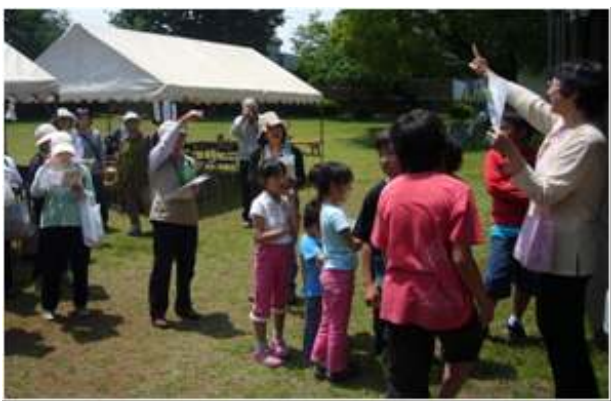
問題の答え合わせ 「この場所が見つかった人～！」 「は～い」