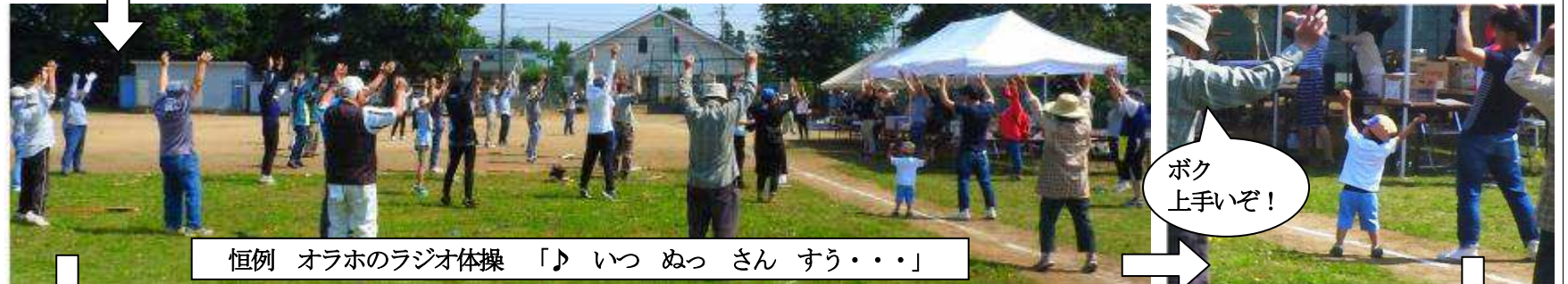
恒例 オラホのラジオ体操 「♪ いつ ぬっ さん すう・・・」