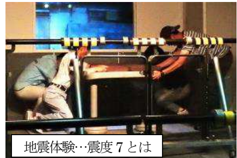
地震体験…震度7とは