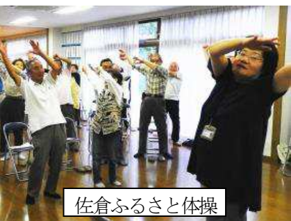
佐倉ふるさと体操