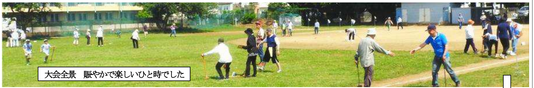
大会全景 賑やかで楽しいひと時でした