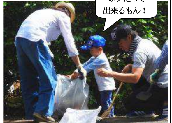
ボクだって出来るもん!