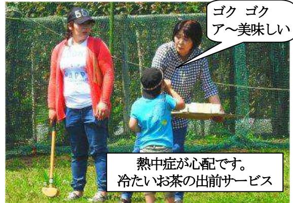
ゴク ゴク ア〜美味しい