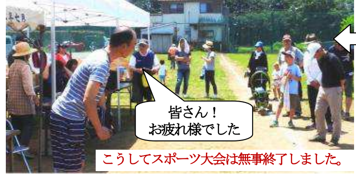
皆さん! お疲れ様でした