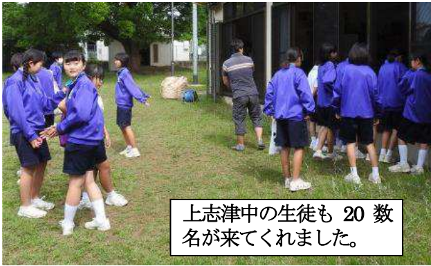
上志津中の生徒も 20 数名が来てくれました。

6月4日(日) 8時30分、上志津原町会恒例の幹線道路清掃・自治会館清掃が実施されました。当日は曇一つない快晴、強烈な陽射しの下皆さん良い汗を掻いていました。