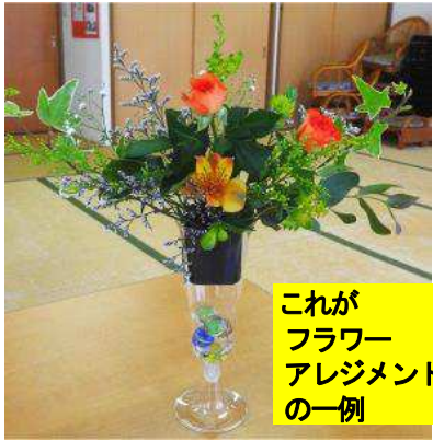
これが フラワー アレンジメント の一例