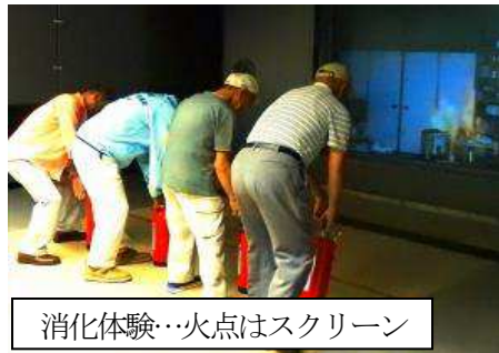
消化体験…火点はスクリーン

都市型水害で浸水して閉じ込められた時、水深とドアの開き具合の体験や、立ってられない程の暴風雨体験など、どれも貴重な体験でした。