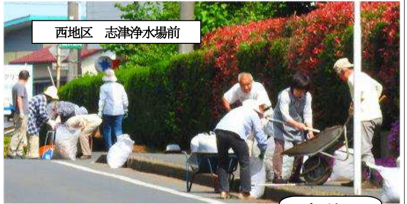
西地区 志津浄水場前

6月4日、幹線道路清掃が行われました。当日は天気も爽やかで、気持ちよく作業する事ができました。上志津中学校のボランティアの生徒さん達も参加し、ふれあいどおり周辺の清掃を手伝ってくれました。