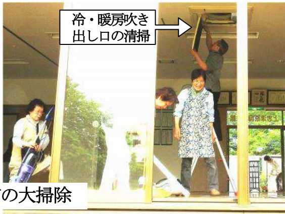
冷・暖房吹き出し口の清掃