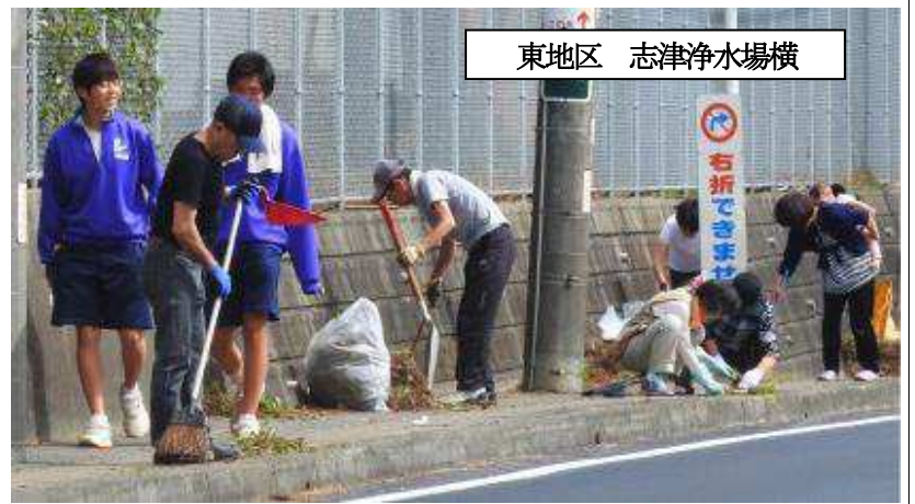
東地区 志津浄水場横