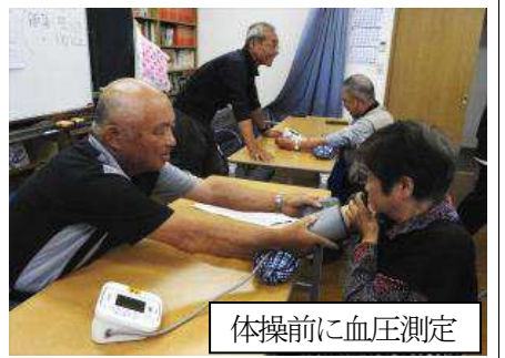
体操前に血圧測定

佐倉ワクワク体操 第1回 6月18日実施 元気がわく! 唾液がわく! 和が広がる! 全部合わせて「佐倉ワクワク体操」。体をほぐし、舌や顔面筋肉を鍛えるお口の体操や、筋力アップの体操まで盛り込まれ、結構楽しい体操でした。 今回は第1回の開催として、双葉会の月例会前に行われ、参加者も殆どが双葉会でした。この体操は毎週行うのが基本らしいのですが、月例会は1回/月 次回からどうするのか、まだ決まっていない様です。