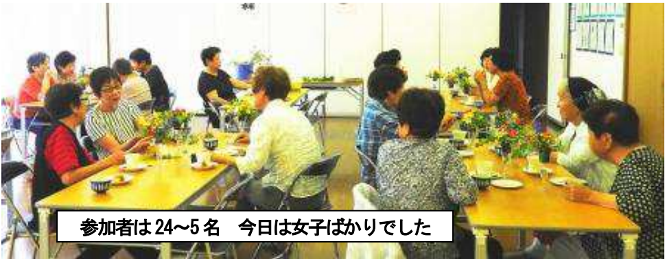
参加者は24~5名 今日女子ばかりでした