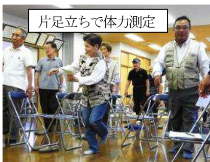
片足立ちで体力測定