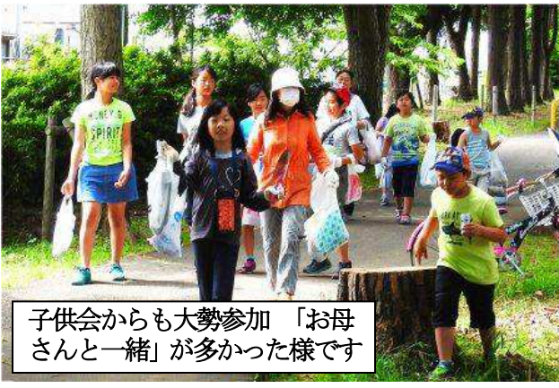
子供会からも大勢参加「お母さんと一緒」が多かった様です