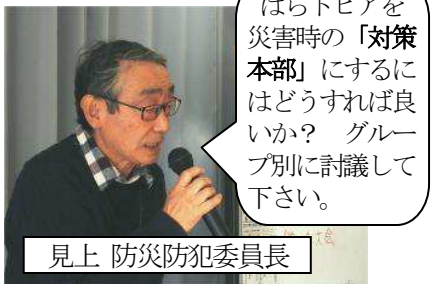
見上 防災防犯委員長

はらトピアを災害時の「対策本部」にするにはどうすれば良いか? グループ別に討議して下さい。