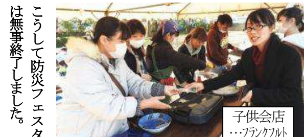
子供会店…フランクフルト