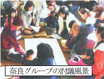
奈良グループの討議風景