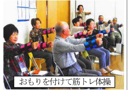
おもりを付けて筋トレ体操