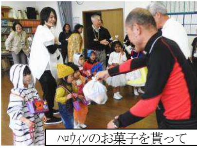
ハワイのお菓子を貰って