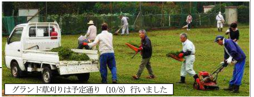
グラウンド草刈りは予定通り(10/8)行いました

でも町会の運動会係はかえって大変だったのです。弁当を頼んだりキャンセルしたり、膨大な賞品の処分などで後々まで解放されませんでした。