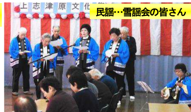
民謡…雪謡会の皆さん