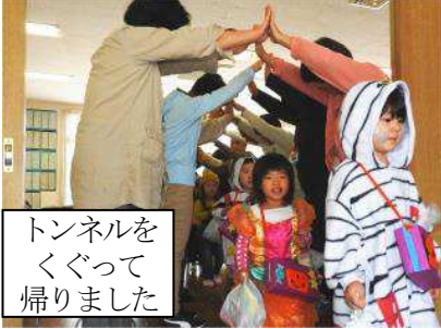
トンネルをくぐって帰りました

取材したのは10月31日(第4火曜日)。この日から「ウェルネス保育園 佐倉」の園児と交流する事になっていましたが、この日はたまたまハロウィン、園児たちは仮装して参加しました。