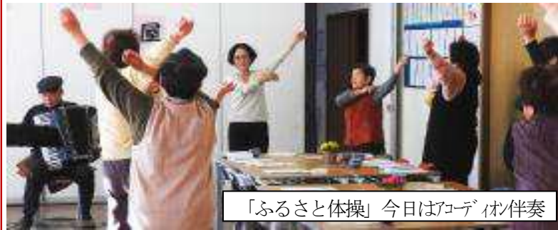
「ふるさと体操」今日はアコーディオン伴奏