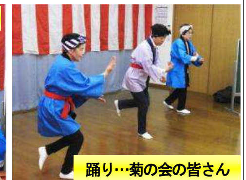
踊り…菊の会の皆さん