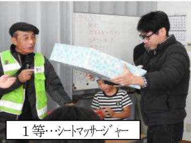
1等…シートマッサージャー