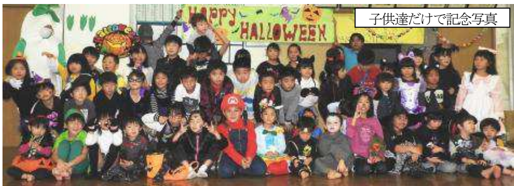
子供達だけで記念写真