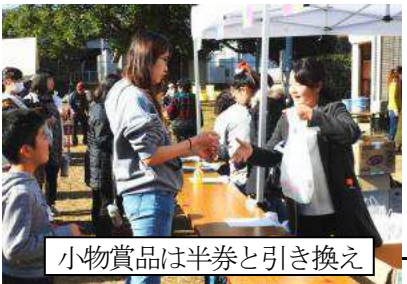
小物賞品は半券と引き換え