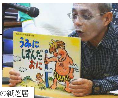
うみにばんだおに