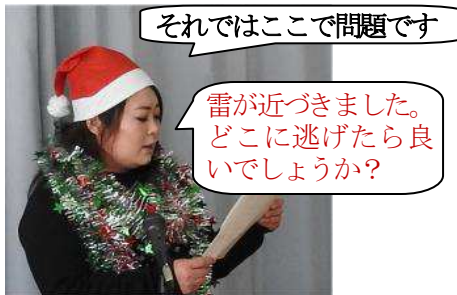
それではここで問題です