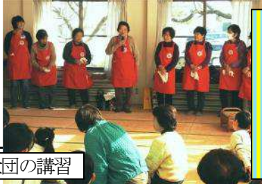
日赤奉仕団の講習