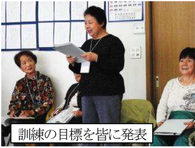
訓練の目標を皆に発表