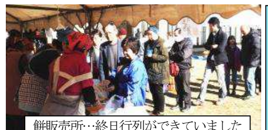
餅販売所…終日行列ができていました