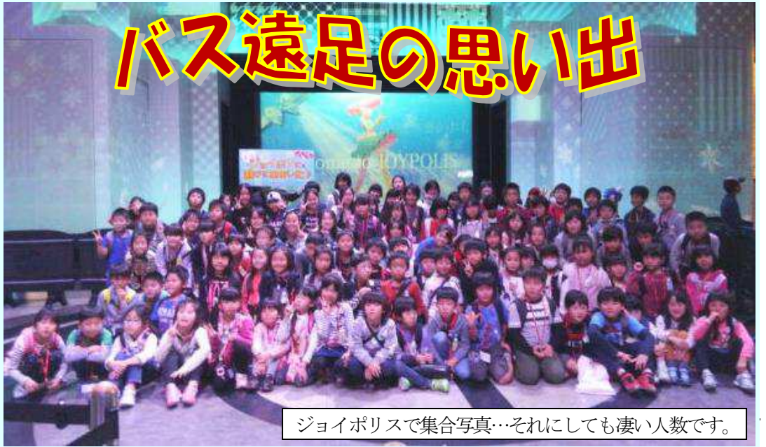
ジョイポリスで集合写真…それにしても凄い人数です。