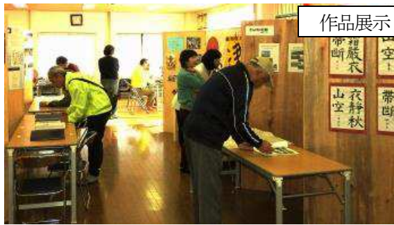
作品展示・閲覧風景