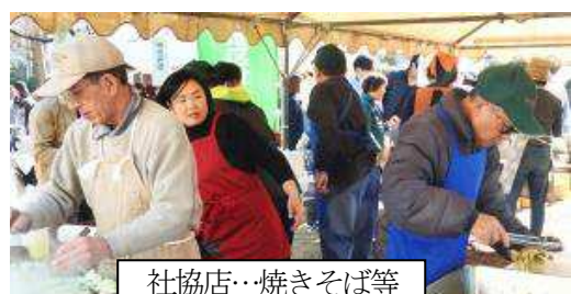
社協店…焼きそば等