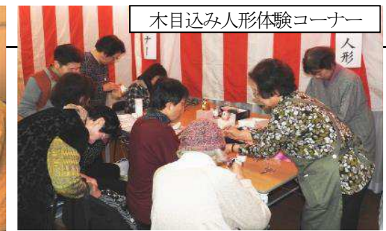
木目込み人形体験コーナー