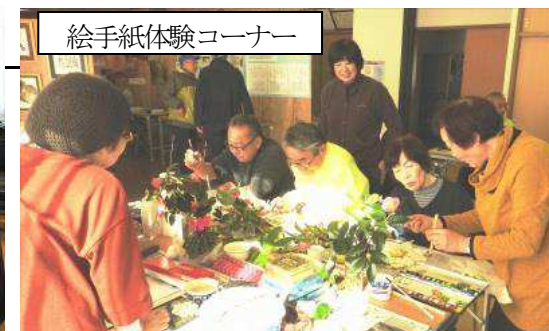
絵手紙体験コーナー