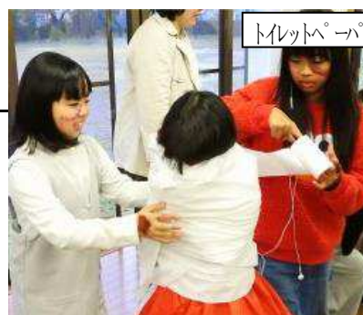
トレットパーでミイラ作り