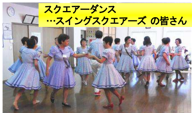
スクエアダンス …スイングスクエアズの皆さん