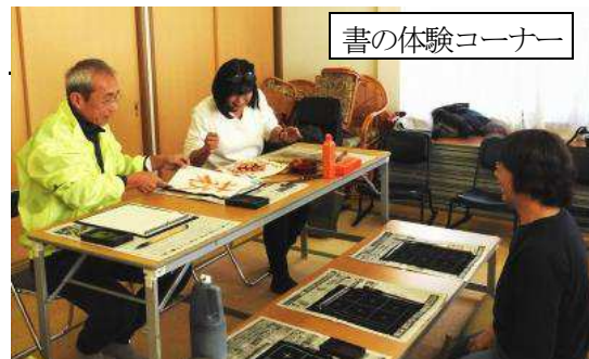
書の体験コーナー