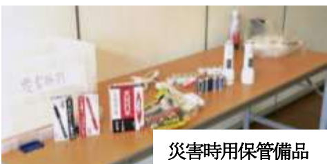
災害時用保管備品