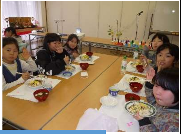
みんなで五目寿司を頂きました