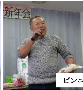
ビンゴゲームあり