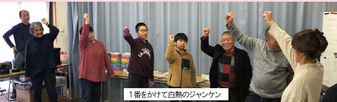
1番をかけて白熱のジャンケン