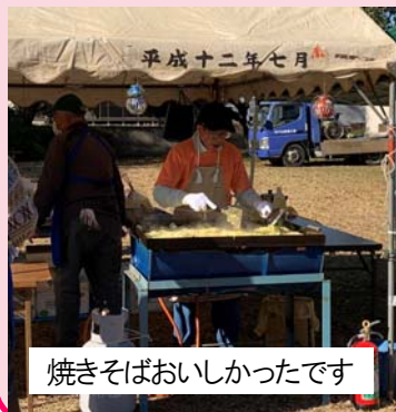
焼きそばおいしかったです