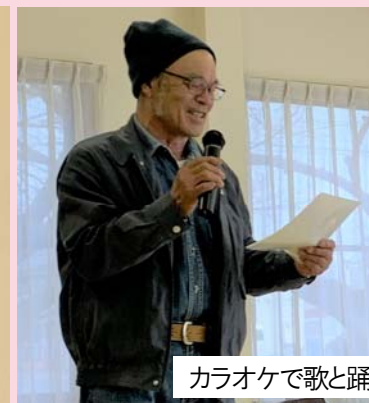
カラオケで歌と踊りを披露！！