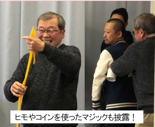
ヒモやコインを使ったマジックも披露！