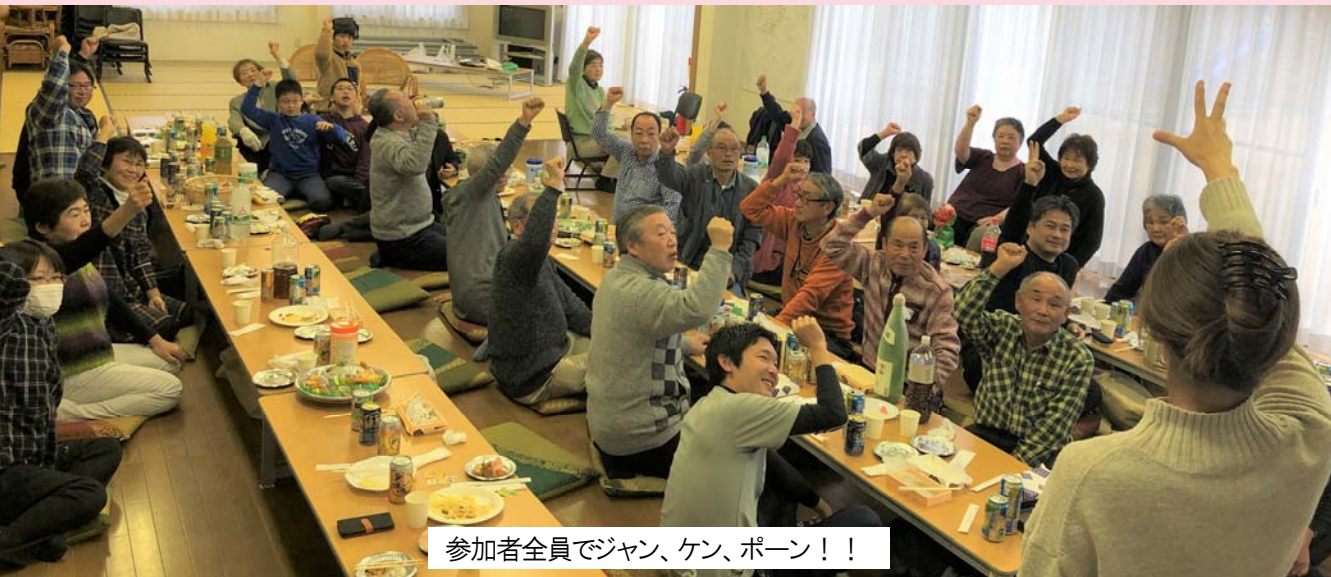
参加者全員でジャン、ケン、ポーン！！