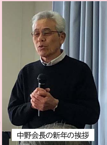
中野会長の新年の挨拶