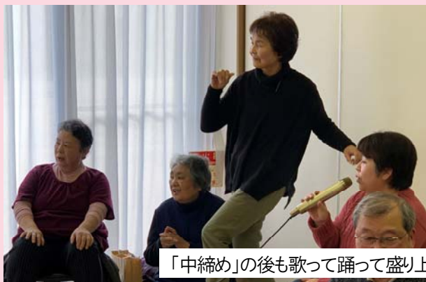
「中締め」の後も歌って踊って盛り上がりました