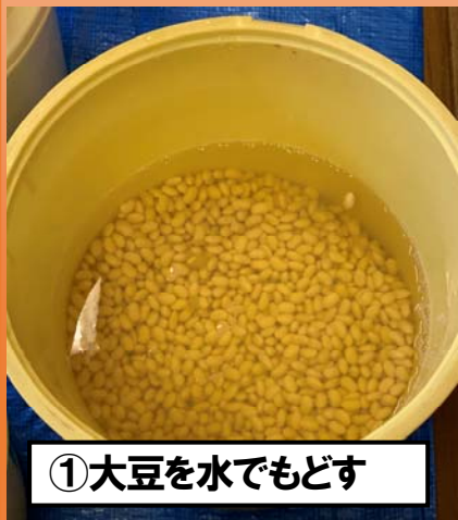
①大豆を水でもどす

2月2日(日) 志津南地区社協 原ブロック主催の味噌づくり講習会が、はらトピアで開催されました。自家製のお味噌、出来上がった味が楽しみです。