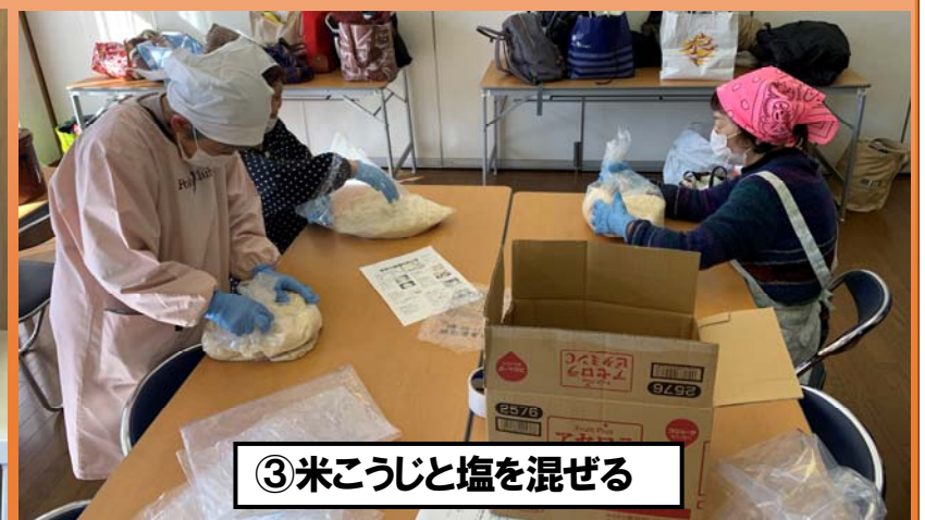
③米こうじと塩を混ぜる