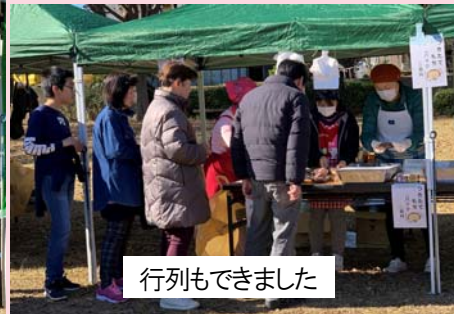
行列もできました