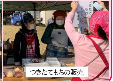
つくたてもちの販売