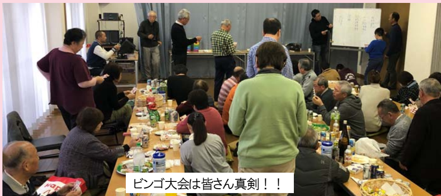
ビンゴ大会は皆さん真剣！！