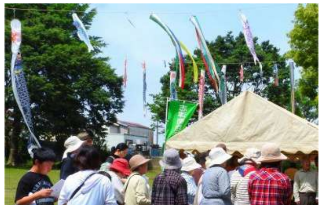
上の写真：昨年のウォークラリーの様子。皆で上志津原探索(周辺地域含む)を楽しむイベント。鯉のぼりはまちづくり委員会イベント部会が担っています。 左の写真：昨年の盆踊り大会の様子。皆の胃袋を満たすため朝から大忙し。オレンジTシャツはシンボルカラーとして定着していますね。 町会行事、各委員会の行事とともに交流の場を提供、盆踊り大会と運動会では出店協力を頂いている頼りになる皆さんです。(広報)

廃品回収(資源ゴミ回収)の収益は、子供会の活動資金となります。子供達のために、ご協力を宜しくお願い致します。 実施日：毎月第 3 日曜日(雨天決行です) ・紙類、ダンボール、牛乳パック、布類は通常のゴミ置き場に ・アルミ缶は 9 時に「はらトピア」まで 佐倉市が行う回収も資源回収ですが、子供会の資金とはなりません。同じ捨てるなら是非とも子供会へのご協力をお願い致します。 3 月の収益は 11,450 円でした。(2019 年度合計 174,260 円) ご協力ありがとうございました！！